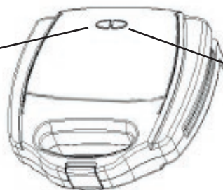
kontrolka dosažení provozní teploty