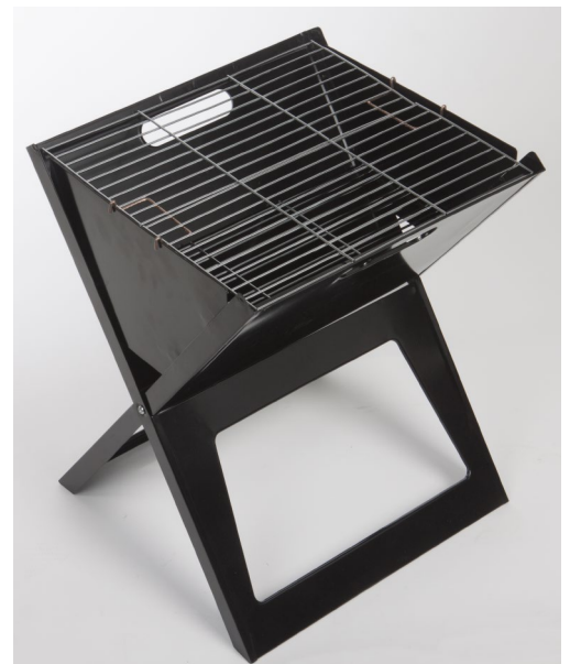
OBRÁZEK 3 Gril kompletně sestavený