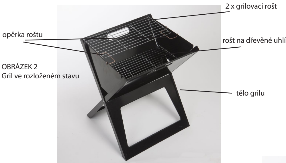
OBRÁZEK 2 Gril ve rozloženém stavu