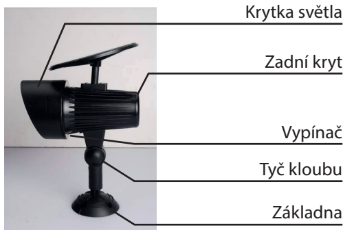
Pohled z boku